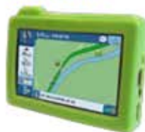
Guscio protettivo di gomma